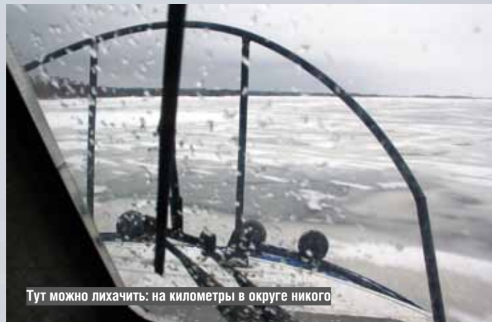
Тут можно лихачить: на километры в округе никого