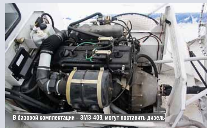
В базовой комплектации – ЗМЗ-409, могут поставить дизель