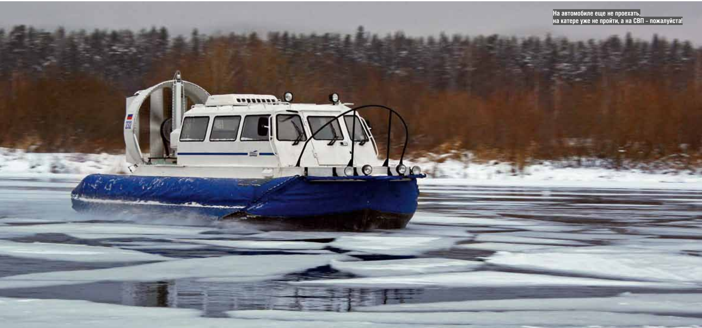
На автомобиле еще не проехать, на катере уже не пройти, а на СВП – пожалуйста!