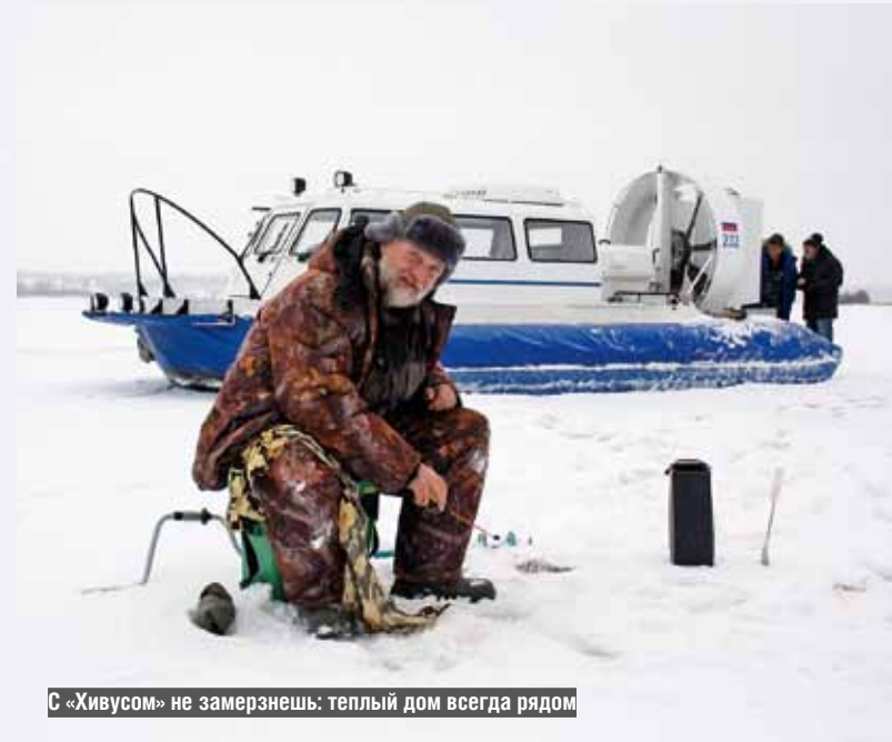
С «Хивусом» не замерзнешь: теплый дом всегда рядом