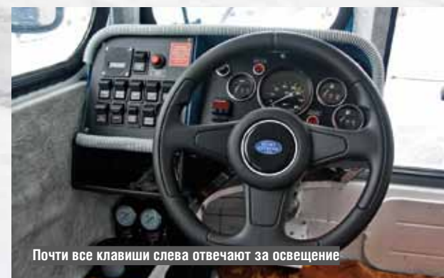
Почти все клавиши слева отвечают за освещение