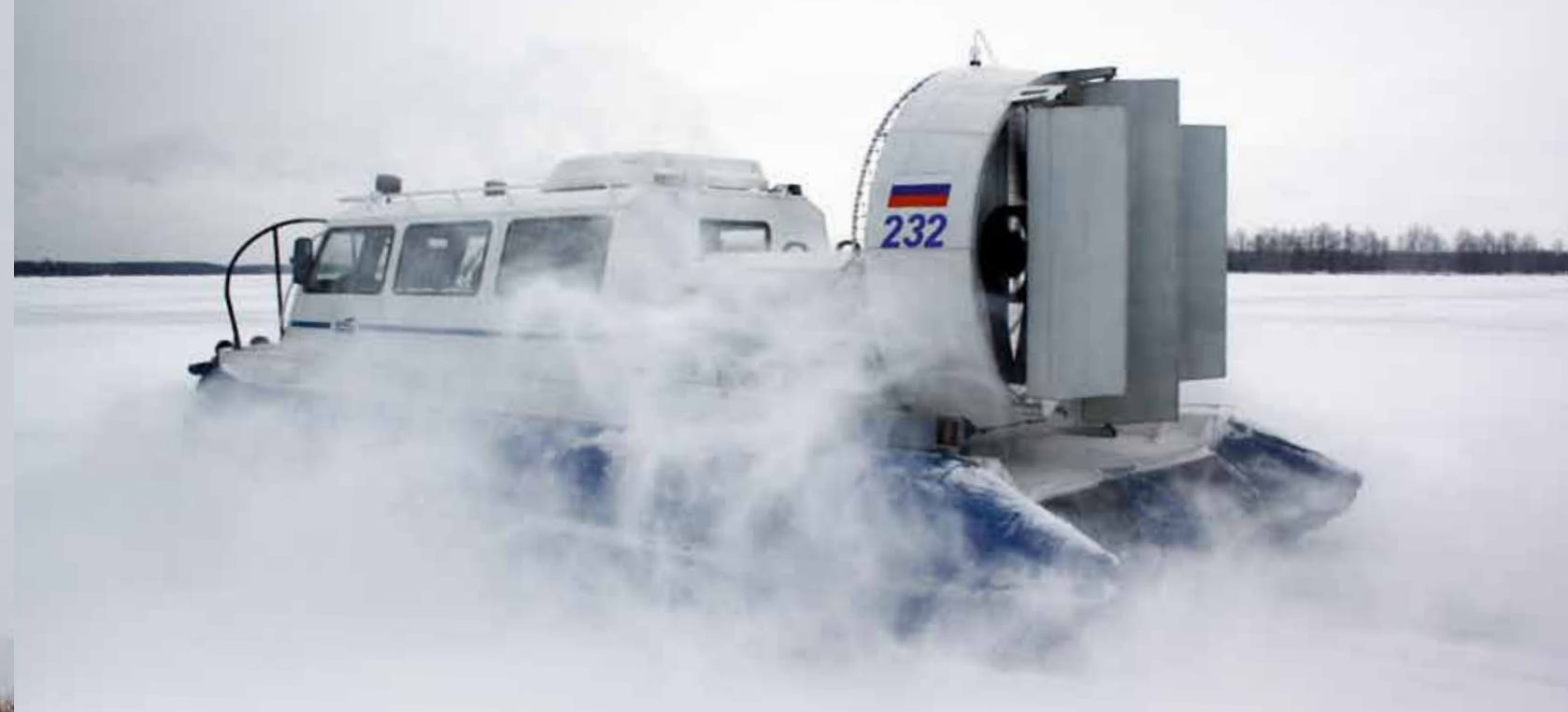
Рядом стоять не рекомендуется – может сдуть

Десятиместную кабину забили под завязку: капитан, моя персона по соседству, соучастники тест-драйва, рыбаки со своими ящиками и бурами. Двигатель пускается точно так же, как на автомобиле, с той лишь разницей, что нет замка зажигания. Вместо него – обыкновенная кнопка. Под левой рукой рычаг «ручника», только отвечает он совсем не за тормоз, которого СВП в массе своей вовсе лишены. Опускающая рычаг, мы включаем сцепление – оба нагнетательных вентилятора и маршевый винт начинают вращаться. Осталось прибавить газ второй ручкой слева, чтобы в какой-то момент судно пришло в движение. По мере разгона газ следует немного убавить – после того как побеждены трение покоя и сила инерции для движения с устоявшейся скоростью хватает меньших оборотов винта.