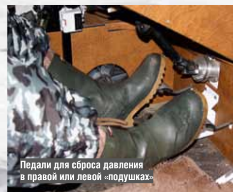
Педали для сброса давления в правой или левой «подушках»