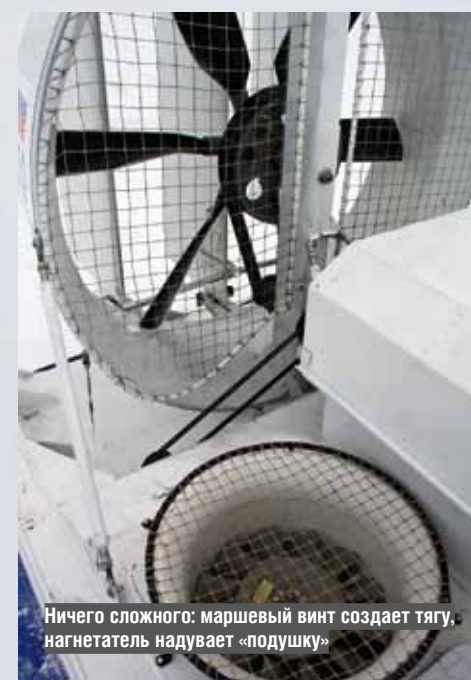
Ничего сложного: маршевый винт создает тягу, нагнетатель надует «подушку»