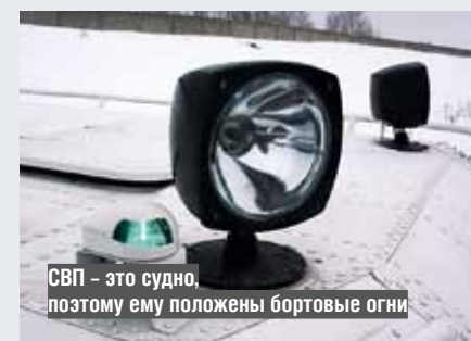
СВП – это судно, поэтому ему положены бортовые огни

Немного углубимся в тему. Существуют распространенная группа СВП, где «юбочное» ограждение применяется не только в носу и корме, но и по бокам. Очевидно, что подобные суда держатся на воде уже только за счет водонепроницаемого корпуса. Пробой алюминиевой обшивки (днища) может привести к затоплению катера. «Хивусы» в этом плане представляются более безопасными. Но они за счет довольно жестких баллонов несколько хуже идут по торосам, справляются с неровностями рельефа, поскольку их гибкое ограждение, простите за тавтологию, недостаточно гибкое, чтобы хорошо прилегать к неровному покрытию. Если щели окажутся слишком большими, то «подушка» сдуется – силы трения окажутся больше силы тяги, что приведет к остановке машины. При прекращении нагнетания воздуха в «подушку» СВП с «юбкой» по периметру мгновенно садятся на корпус. На воде это не особенно страшно, но на твердой поверхности получается мощный удар. Чтобы корпус переносил подобные казусы безболезненно, его приходится делать более прочным, а значит тяжелым – падает полезная грузоподъемность. А вот «Хивус» при сбросе оборотов двигателя садится на свои баллоны и скользит на них, как на лыжах.