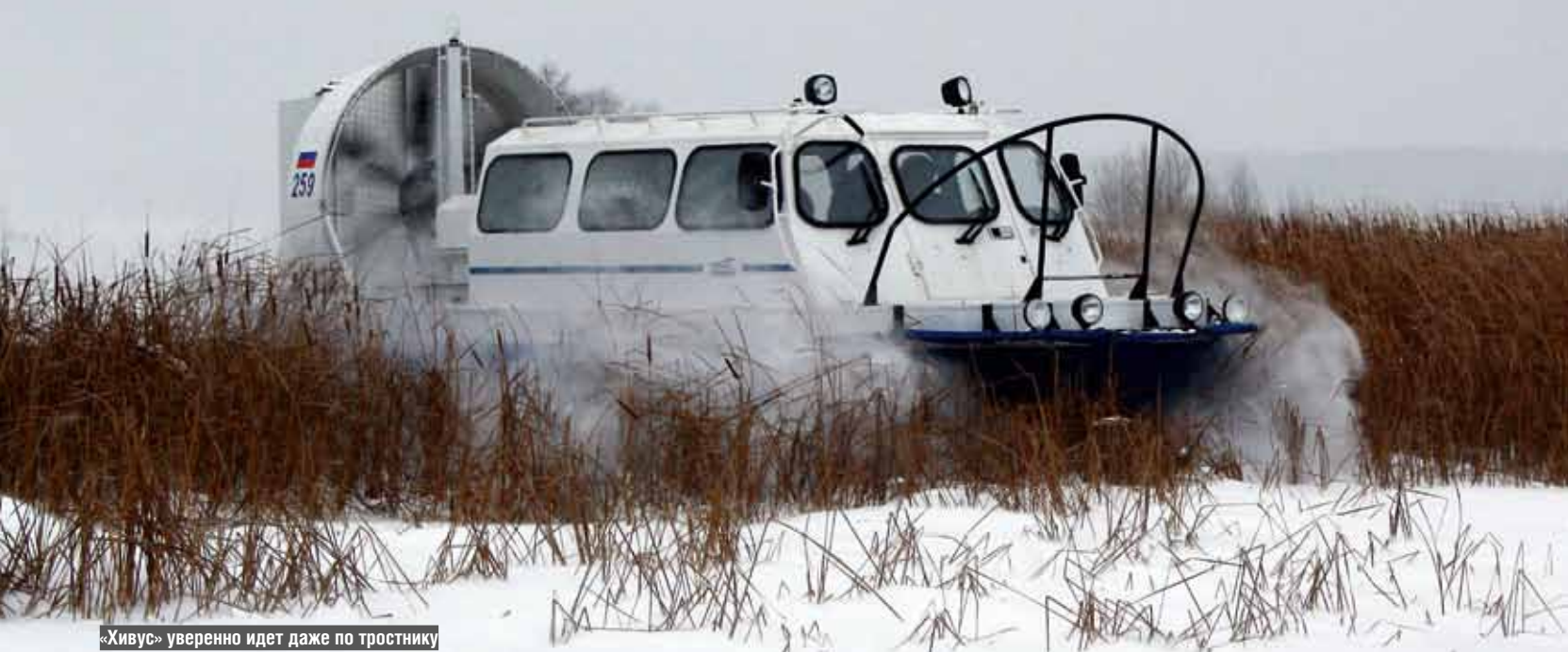
«Хивус» уверенно идет даже по тростнику

редаточное число первой в случае применения бензинового двигателя ЗМЗ-409 составляет 1:4, второго – 1:1. Пользуются спросом и дизельные «Хивусы». Известно, что на Крайнем Севере, в Сибири почти весь транспорт потребляет солярку, и наличие бензиновой машины там не слишком удобно. Пожалуйста, получите «подушку» с Iveco F1C (стоимость, правда, при этом возрастает на треть). Поскольку дизель менее оборотист, чем ЗМЗ, для обеспечения тех же оптимальных для движения оборотов маршевого винта применяют передаточное число главной передачи с меньшим соотношением. Зачем нужно сцепление? Чтобы не всегда при работе мотора СВП гнал воздух вниз и назад – автомобиль ведь тоже часто тархтит на холостых оборотах, никуда не двигаясь.