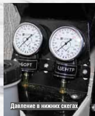
Давление в нижних скегах