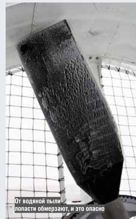
От водяной пыли лопасти обмерзают, и это опасно

Вы наверняка знаете, что управляемость автомобиля со спущенными колесами оставляет желать лучшего. Точно так же и СВП с мягкой, хорошо облизывающей препятствия «юбкой» управляется посредственно, в отличие от жестко сидящего на своих баллонах «Хивуса». Это в теории, чуть позже мы перейдем к практике.