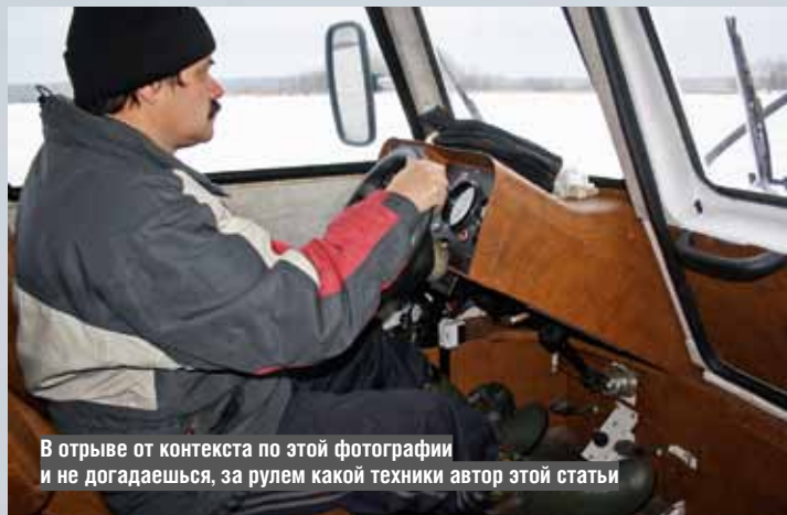
В отрыве от контекста по этой фотографии и не догадаешься, за рулем какой техники автор этой статьи