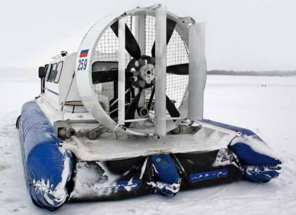
Изменяя направление воздушного потока, добиваются поворотов машины

«Подушка» «Хивуса» разделена на две равные части продольным средним баллоном. Каждый отсек накачивается своим вентилятором, получающим привод от главного трансмиссионного вала. Он же передает крутящий момент от двигателя к маршевому винту. Никаких коробок передач, как на автомобиле, здесь нет и в помине. Короткий карданный вал, компенсирующий несоосность установки приводов, связывает ведомый диск сцепления со шкивами ременных передач приводов основного винта и нагнетательных вентиляторов. Пе-