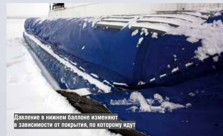
Давление в нижнем баллоне изменяют в зависимости от покрытия, по которому идут